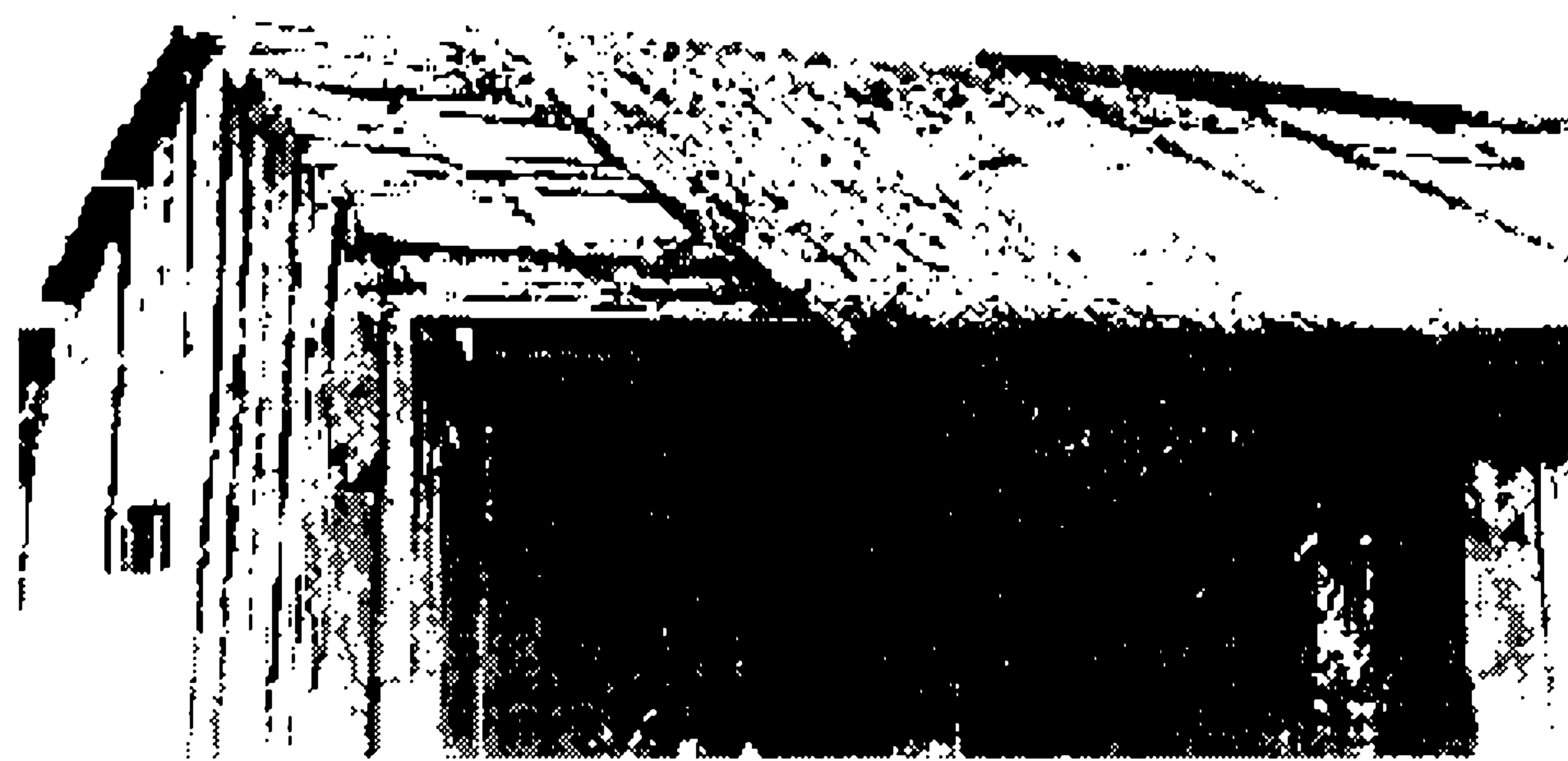
Фото 6. Фрагмент камышовой кровли. с. Коробейниково Усть-Калманского р-она. 1997 г.

При такой технике строительства преимущественным кровельным материалом являлись солома и камыш. Преобладала укладка соломы способом «внатруску»: «Солому начинаешь прямо изпод низу класть. Кладешь ее широко толсто. Ходишь по ней. И кроешь, кроешь, угантываешь кругом.» Такой кровли, ныне изредка не используется лишь на хозяйственных постройках при крайней нужде, т.к. «солома быстро загнивает. Она плотно не ложится, шероховато, ямочки получаются. Дождь попадает. Одно, два лета