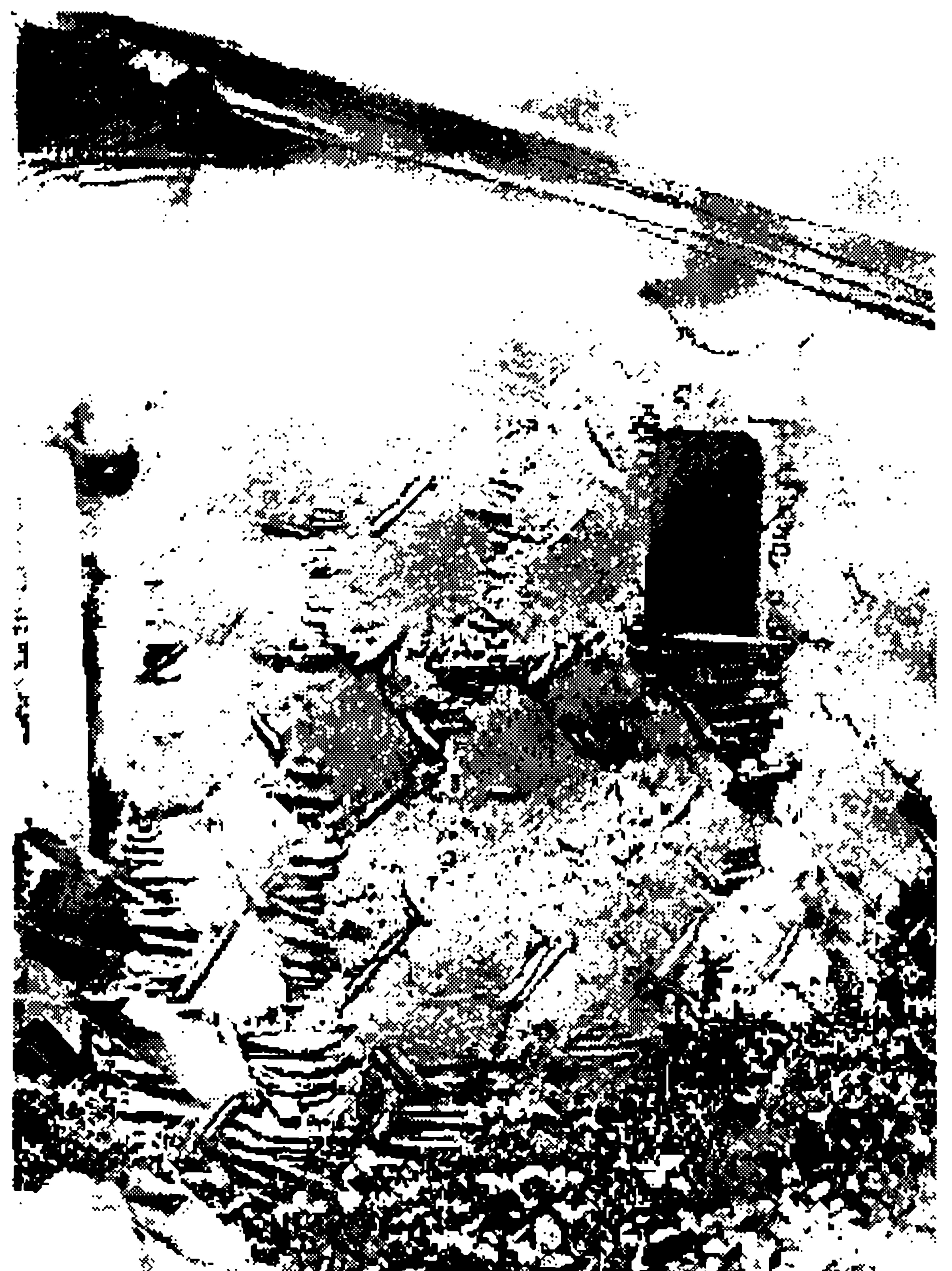
Фото 4. Плетеный хоздвор, заштукатурен глиной с соломой. с. Усть-Калманка. 1995 г.

Техника строительства была первобытная: «На лугу крепкую целину резали лопатами (в других случаях плугом). Не телегах возили. Пласты клали друг на друга. Связывали, чтобы не развалились: один вдоль, другой поперек. Потом клали на дерн матку. Потом «сволочки» - жерди, потом чашу, сверху сено. Чтобы не сыпалось - мазали глиной с соломой. И стены мазали кругом снутри и снаружи. Крышу землей закидывали». (Е.И. Дмух, 1907 г.р.). Иногда дернование сопровождалось плетением каркаса: «навозила чашу» сплела плетень, с избы заштукатурила,