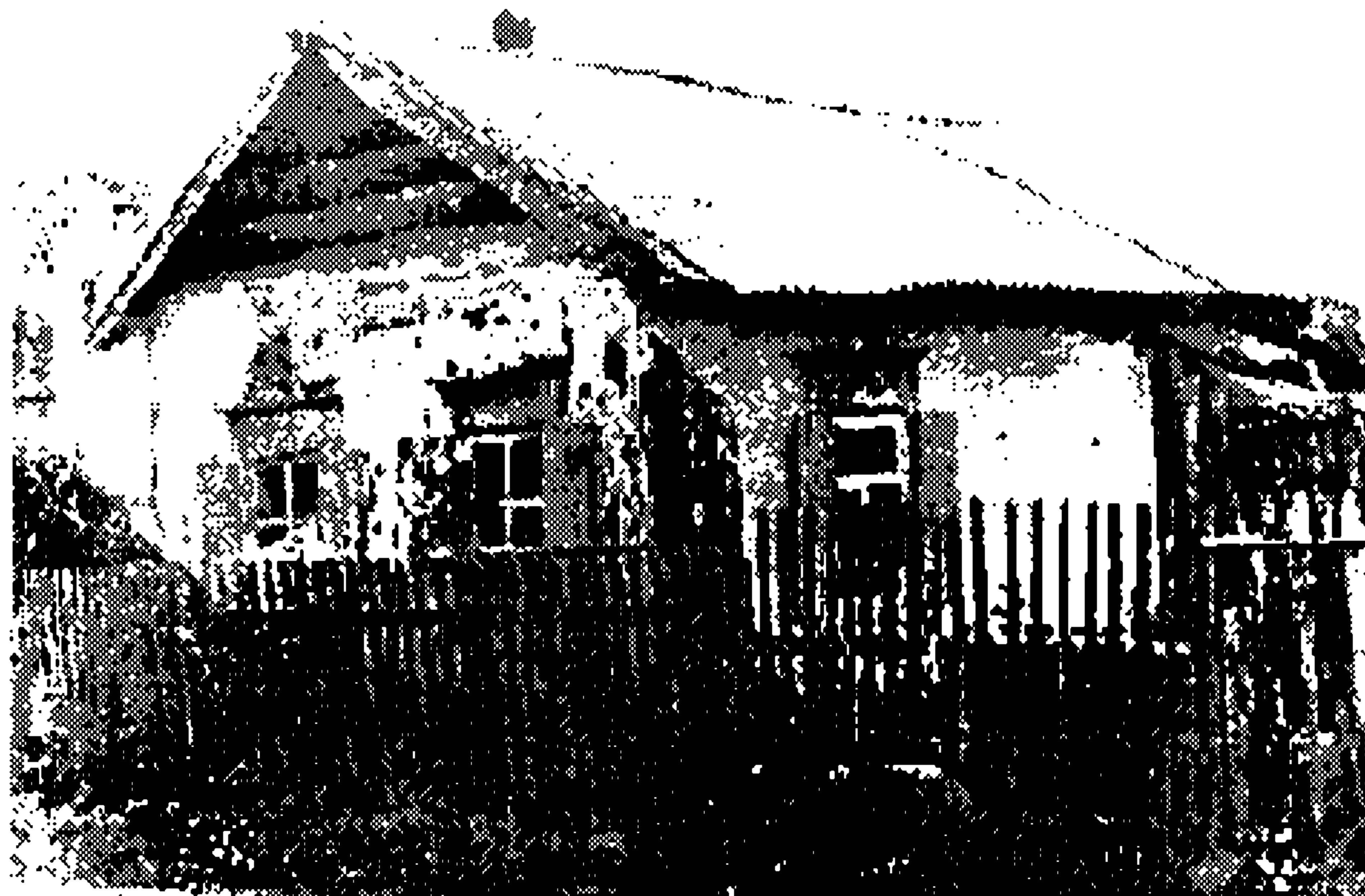
Фото 2. Дом перестроен в 30-е годы из перевезенного амбара. Имеет классические размеры 3,5x5,0 м., с. Усть-Калманка. 1995 г.

Обычно в перестроенных жилых вариантах использован однокамерный тип амбара, реже двухкамерный (фото 2). При этом из амбарного сруба выбрасывались внутренние перегородки сусеков и закрома. Общая прямоугольная площадь делилась поперек внутренней стеной на две комнаты. В наружных стенах прорубались оконные проемы (обычно на южном и западном фасадах),