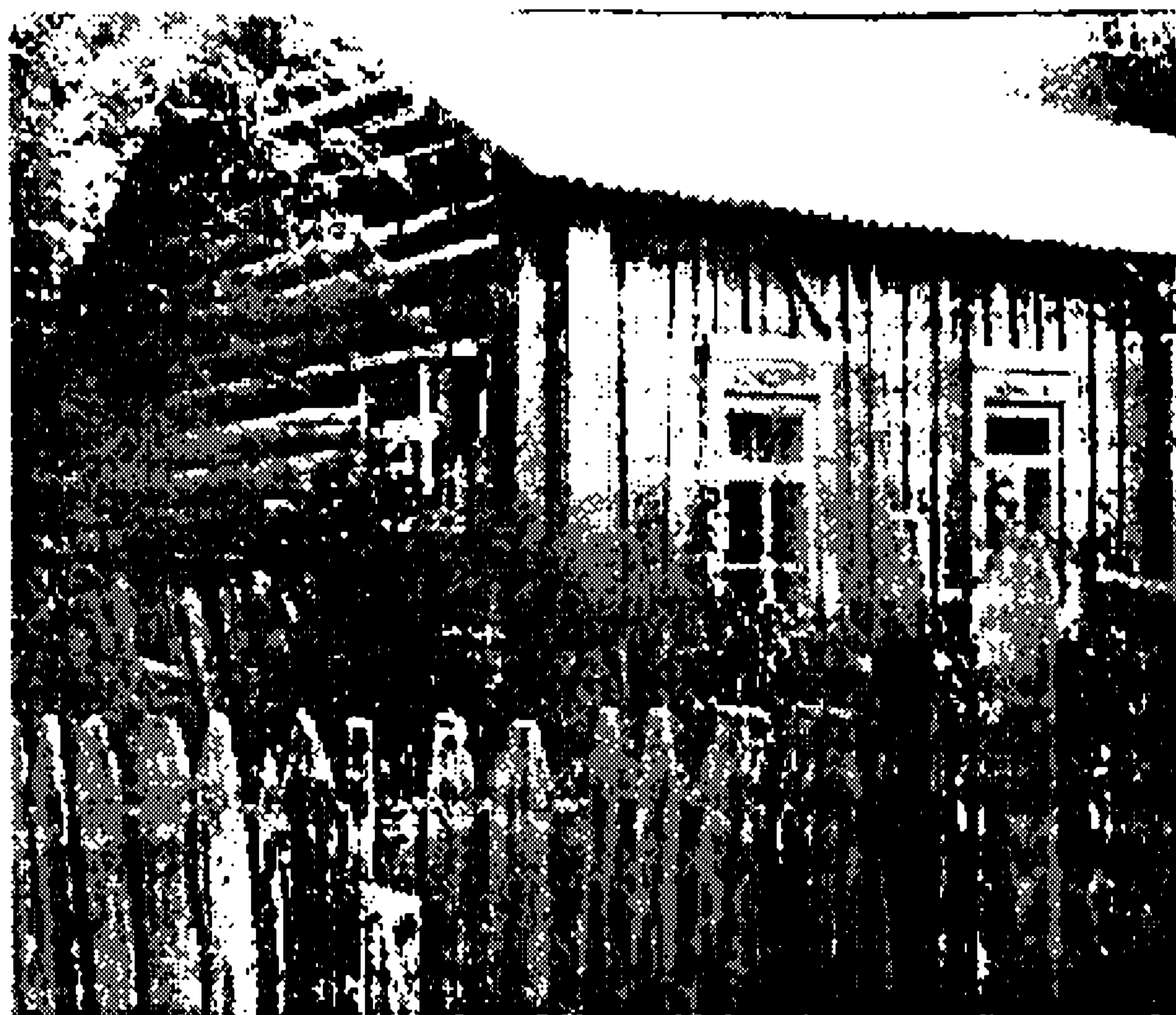
Фото 1. Жилой дом с самцовой конструкцией крыши - «по- амбарному», с. Куяча Алтайского р-она. Фото автора, 1994 г.

(при его наличии) - из лиственницы; остальные венцы сруба, стропила, подстропила, внутренние перегородки - из сосны. Ограничение возможностей индивидуального подбора и заготовки леса привело к вторичному использованию леса, особенно лиственницы из старых (кулацких) домов и хозяйственных построек, в первую очередь амбаров, которые в результате перехода от единоличного хозяйствования к коллективному потеряли свое значение. На Алтае повсеместно встречаются избные и пятистенные лиственничные дома с двухскатной самцовой конструкцией крыши, перестроенные из амбара, сохранившие размеры и отдельные элементы народного зодчества: самцы, помочи, высокую постановку сруба на лиственничных чурках (фото 1).