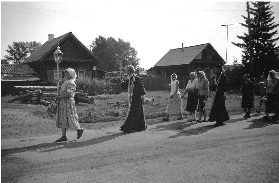
Рис. 5. Крестный ход к святому ключу в день Казанской Богоматери, с. Усть-Серта Чебулинского р-на Кемеровской области.

каются сведения о характерных для данной местности несчастьях и бедствиях, определенным образом «накладываются на видимые границы локальных групп». Основная функция местных святынь, образующих, по определению Т.Б. Щепанской, своего рода «кризисную сеть», заброшенную на заселенную территорию, заключается, таким образом, в поддержании «эколого-демографического равновесия (баланса между ресурсами территории и воспроизводством жизни на ней)». 29 Вместе с тем, формы взаимоотношений человека и святыни, по справедливому замечанию В.В. Виноградова, не могут сводиться только к «кризисной» или «экстремальной» модели. Будучи органичной частью календарной обрядности округа, ежегодные посещения сакральной точки в праздничные дни способствуют скорее «не ликвидации «кризиса», а сохранению достигнутого баланса сил в окультуренном пространстве». При этом сами святыни, то есть, почитаемые с детства места, нередко воспринимаются как символы «малой» родины, аккумулирующие в себе коллективную историческую память и формирующие локальную идентичность местного населения. 30