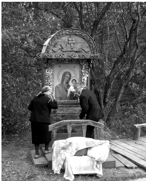
Рис. 7. Богомольцы у иконы Казанской Богородицы в день Усекновения главы Иоанна Предтечи, с. Сорочий Лог Первомайского р-на Алтайского края.

течи (11 сентября н.ст.), когда церковь поминает убитых на поле брани воинов (рис. 7). Пережив период упадка в годы советской власти, святой ключ вновь привлекает внимание паломников. Несколько лет назад в Сорочьем Логу появился женский Богородице-Казанский Иоанно-Предтеченский Скит, по инициативе Барнаульской епархии ведется строительство храма, разбит цветник, а само «святое место» обложено срубом, настилом и навесом. Владыка из Барнаула регулярно проводит крестные ходы к роднику, по окончании которых устраиваются массовые крещения детей и взрослых. Приезжая из ближних и дальних мест в надежде получить исцеление, люди увозят с собой воду и глину с песком в больших в пластиковых бутылках и стеклянных банках (ПМА, 2004). Все это соответствует отмеченной в последнее время тенденции использования почи-