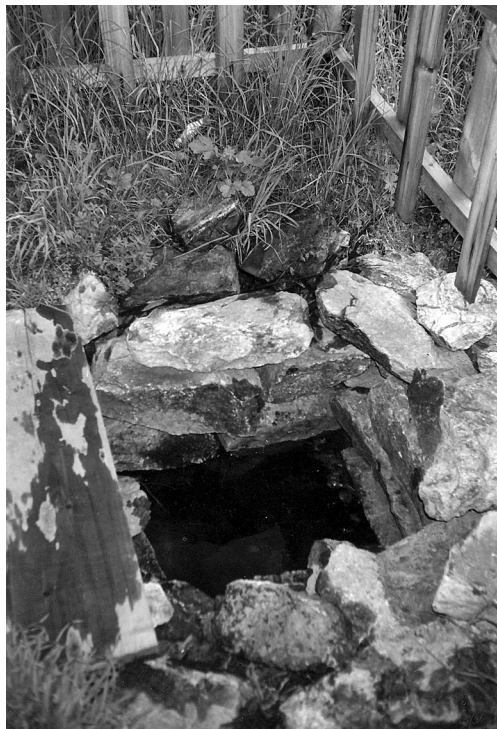
Рис. 1. Колодец со святой водой возле с. Жуланиха Заринского р-на Алтайского края

Местной святыней и религиозным символом праздника стала икона Казанской Божьей Матери, история которой драматична и в то же время достаточно типична. Появление ее в селе окутано тайной и связано с легендами о том, что сама «икона – явленная»: рассказывают, что лик Богородицы «являлся» в местном ключе. Вместе с тем, известно, что до 1936 г. местом пребывания иконы, размеры которой достаточно внушительны, а вес достигает 20 кг, была церковь, а после –