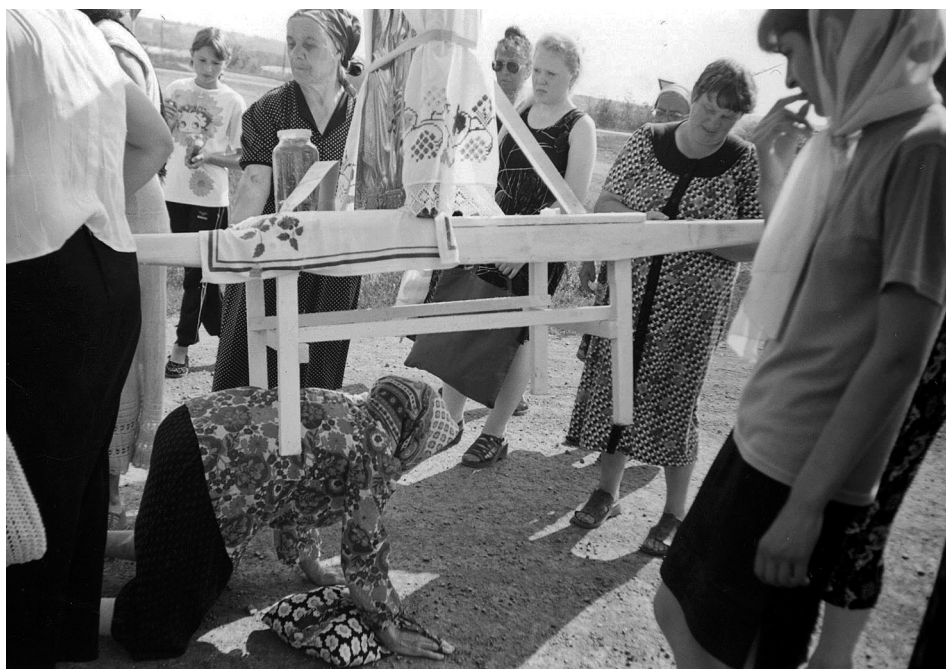
Рис. 6. Прелезание под иконой Казанской Богородицы во время крестного хода к святому ключу (там же).

ственное шествие верующих и духовенства с иконами и хоругвями к святому источнику, расположенному приблизительно в четырех километрах от селения (рис. 5). Исключительный интерес в данном случае представляет то, что пространство, образованное движением крестного хода, и в наши дни воспринимается верующими как сакральное. Участники состоявшегося в 2002 году шествия, среди которых были представители как старшего поколения, так и молодежь, желая получить исцеление от той или иной болезни, ложились на землю или проползали на коленях под носилками с установленной на них иконой Богородицы (рис. 6). Как пояснила одна из местных жительниц, А.П. Зорина (1922 г.р.), «когда Казанскую несут, то тот, кто хочет исцелиться, крестится и под нее подлезает, а саму икону над ним проносят». Происходящее при этом символическое пересечение границы сакрального и профанного миров, по мнению А.А. Панченко, означает приобщение богомольцев к святости и благодати, заключенной в местной святыне. 31