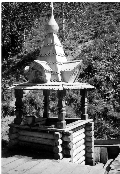
Рис. 3. Святой ключ в с. Сорочий Лог Первомайского р-на Алтайского края.

другом месте» (ПМА, 2004). Общественное мнение, таким образом, было подготовлено к восприятию очередного «чуда», которое не заставило себя долго ждать. Матери одного из расстрелянных, каждый день ходившей на место гибели сына, привиделся в ключевой воде лик, будто бы сообщивший ей о том, что все погибшие «признаны Богом невинными мучениками», а возникший на месте их гибели родник – это «слезы матерей по невинно убиенным». 13 Местное духовенство способствовало распространению новой легенды, а традиционные обходы полей в случае засухи («с иконами и с батюшкой») стали включать в себя обязательное посещение новообнаруженной святыни (ПМА, 2004).