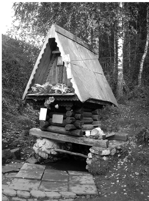
Рис. 4. Почитаемый источник в п. Ложок Искитимского р-на Новосибирской области.

Подтверждением сакрального статуса источника в Сорочьем Логу стали зафиксированные в Повести предания о регулярном явлении «божественных ликов» в святой воде, а также многочисленные рассказы о случаях чудесного исцеления: