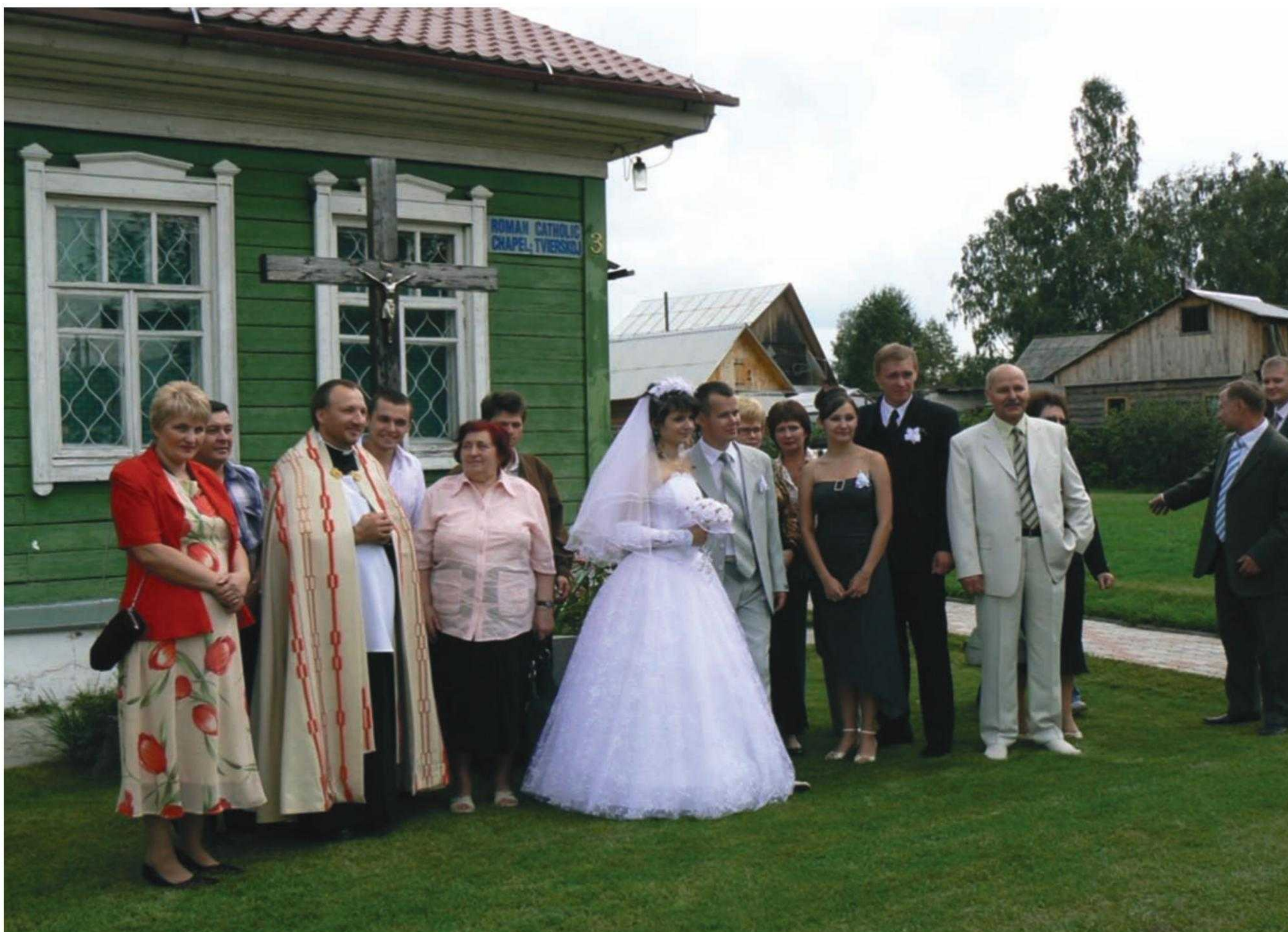
Польская свадьба в г. Бийске

но также активизировать работу в области городской этнографии. По этой причине в этноатласе предусмотрены разделы о функционировании этнических традиций в городской среде.